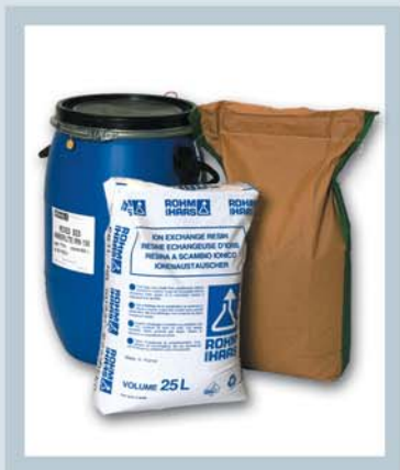
PROD. QUÍM. SÓLIDOS