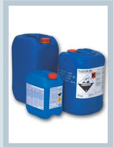
PROD. QUÍM. LÍQUIDOS